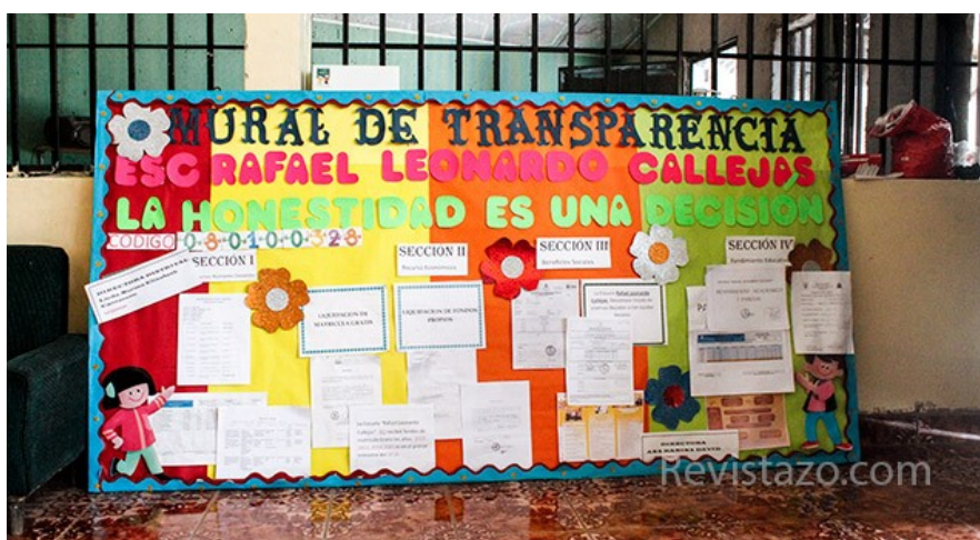
Mural de la transparencia decorado por los alumnos de la escuela Rafael Leonardo Callejas.

Hoy, este señor, que pese a la condena social, hasta hace poco era considerado honorable en su círculo político-empresarial, enfrenta cargos de cinco delitos en una corte federal de Estados Unidos, país que lo solicitó en extradición. Callejas y 41 dirigentes más del fútbol de la Concacaf y Conmebol, son acusados de recibir 200 millones de dólares en sobornos por derechos de transmisión de torneos y partidos de las selecciones nacionales. De los acusados, 13 incluyendo Callejas, se han declarado culpables. Callejas acepto dos de los cinco delitos que le imputan y podría ser condenado a 20 años de cárcel.