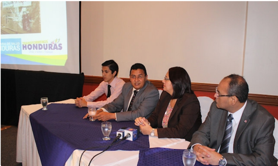
Transformemos Honduras presentó el informe Comisión interventora del Almacén Central de Medicamentos.